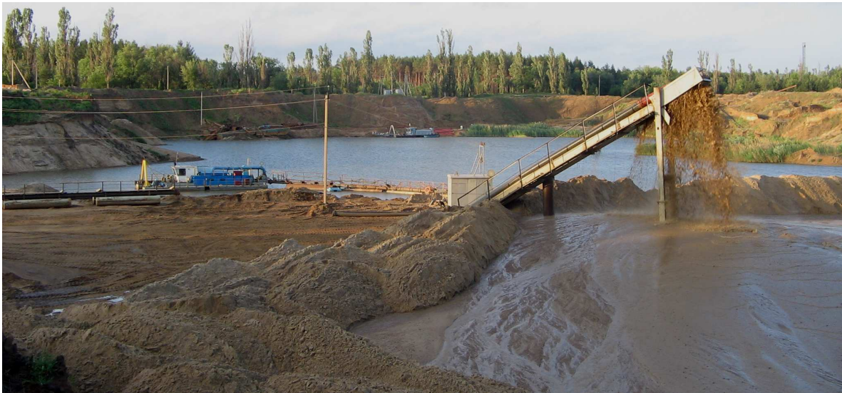
Рис. 4. Переробка піску на грохоті ГПК

Впровадження КВП «земснаряд–пульпопровід–класифікаційна установка» для розробки обводненого родовища піску з використанням грохота ГПК для переробки гірничої маси, у цінах 2008 р., забезпечила: зменшення витрат ПММ на 7,2 тис. л/рік (50 %); зменшення собівартості видобутку піску на 2,15 грн./м 3 (10,6 %); збільшення вартості реалізації продукції за рахунок підвищення її якості на 13 грн./м 3 (52 %) (табл. 2).