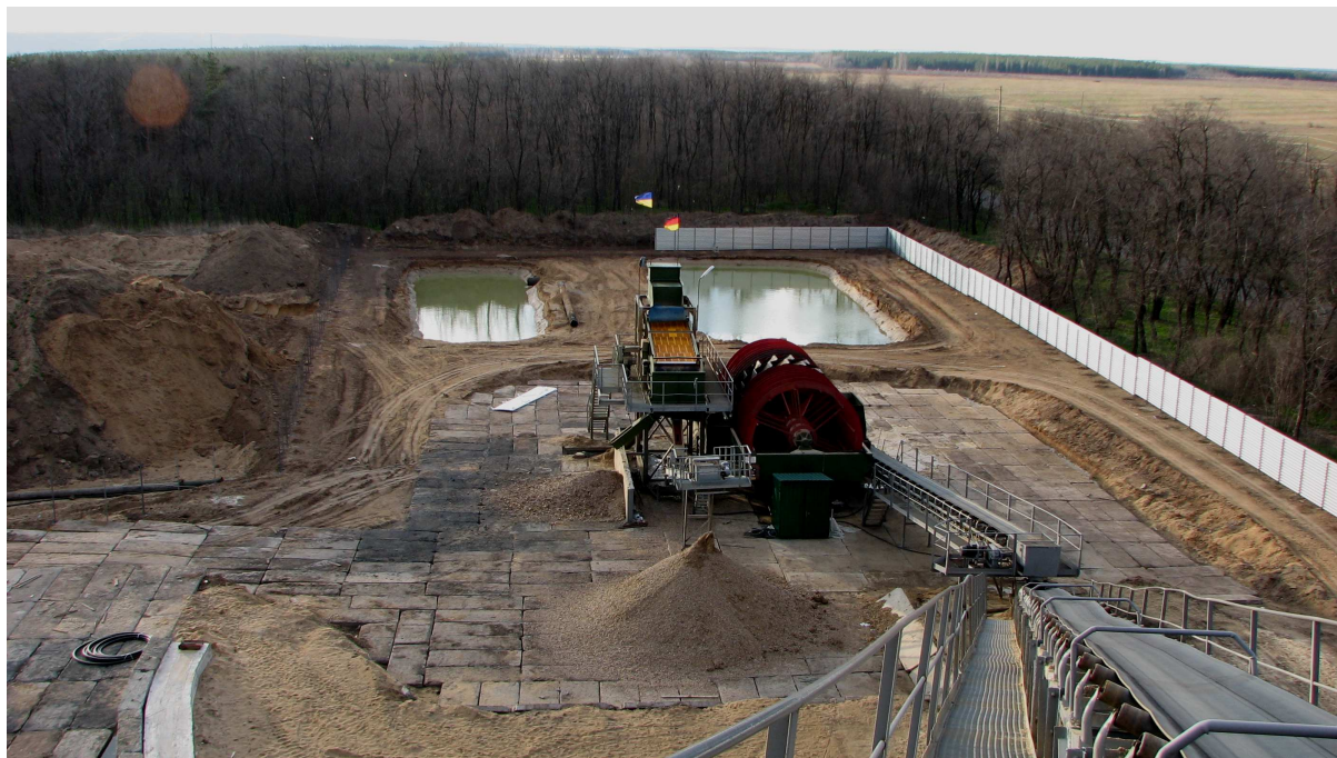
Рис. 2. Комплекс з переробки піску Олександрівського піщаного кар'єру

Таким чином, упровадження запропонованого КВП «земснаряд–пульпопровід–класифікаційна установка» для видобутку й переробки будівельних пісків забезпечило збільшення продуктивності підприємства на 104,3 тис. м 3 /рік (28 %) і зменшення собівартості продукції на 1,94 грн./м 3 (13 %). Фактичний річний економічний ефект за результатами 2007–2008 рр. склав 931 394,0 грн.