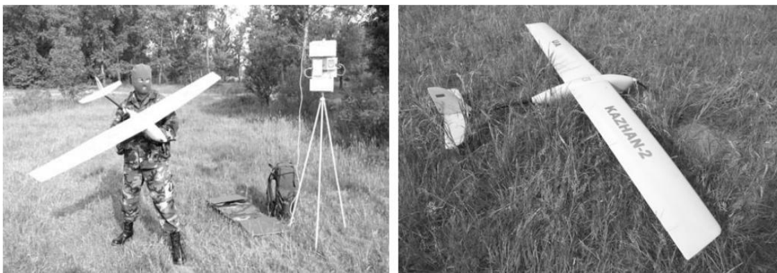
Рис. 4. Мобільний багатоцільовий БпАК “Кажан-2”

У системах керування безпілотних засобів різного призначення можуть використовуватися як принципи програмного керування, так і методи командного радіокерування або телекерування [1, 3, 4]. Під телекеруванням розуміється керування ЛА з пункту управління (ПУ) шляхом передавання на борт керуваного об'єкта команд для впливу на положення рульових елементів. При цьому дані про об'єкт, на який здійснюється наведення (цілі), можуть бути отримані безпосередньо з ПУ [4].