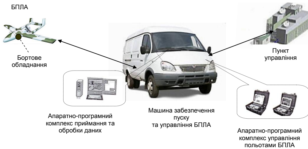
Рис. 2. Варіант безпілотного авіаційного комплексу

В деяких БпАК, наприклад “Грант”, машина пуску та управління реалізовані на двох автомобільних платформах (рис. 3).