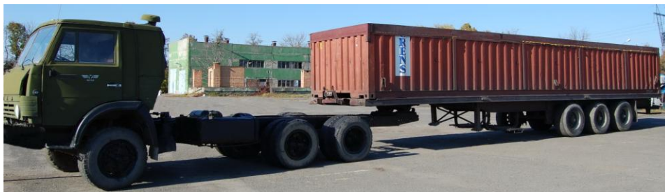
Рис. 1. Експериментальний автопоїзд-контейнеровоз