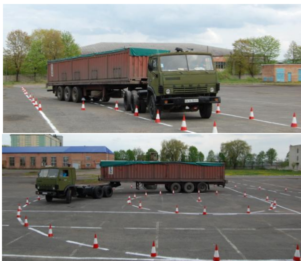
Рис. 2. Види випробувань автопоїзда-контейнеровоза для проведення досліджень його маневреності

При виконанні таких маневрів, як усталений рух по колу, “поворот на 90°”, “поворот на 180°”, “поворот на 270°”, “S-подібний поворот” тощо оціночним критерієм служитиме максимальна ширина габаритної смуги руху (ГСР). Під час випробувань “поворот на 180°” додатковим оціночним критерієм буде величина ширини коридору, необхідного для розвороту автопоїзда-контейнеровоза.