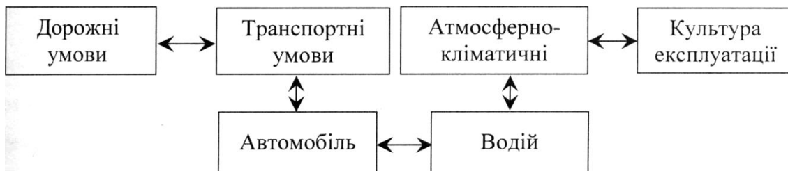
Рис. 1. Взаємодія системи «автомобіль–водій» з елементами зовнішнього середовища

Людино-машинна система «автомобіль–водій» функціонує в складних зовнішніх умовах (середовищі). Тому її працездатність необхідно розглядати в безпосередньому зв'язку із зовнішнім середовищем. Система «автомобіль–водій» повністю проявляє свої властивості в процесі взаємодії із зовнішнім середовищем (рис. 1). Автомобіль не можна ізолювати від умов експлуатації і робочих процесів, що протікають в його агрегатах. Під умовами роботи системи розуміється все те, що оточує цю систему і знаходиться в тісній взаємодії з нею. Розмежування середовища і системи при їх аналізі дещо суб'єктивно і визначається умовами вирішуваного завдання.