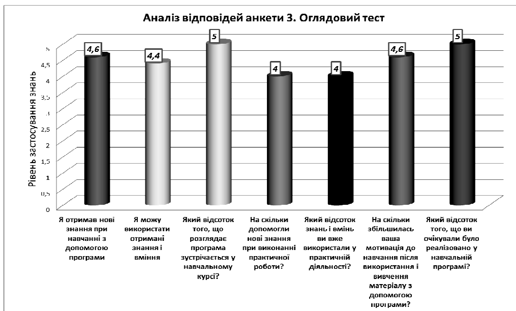
Рис. 2. Середні показники рівня застосування знань після вивчення програми навчального курсу

Після проведення анкетування на основі результатів була побудована діаграма середніх показників оцінок студентів після вивчення ними програми (рис. 2).