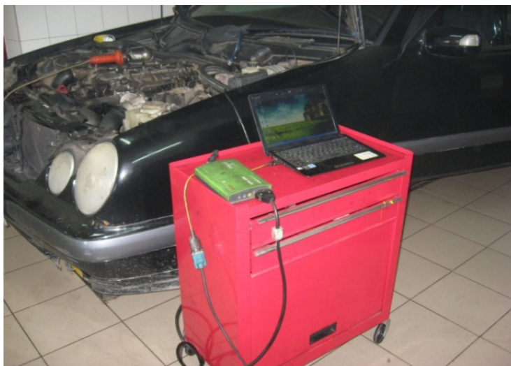
Рис. 1. Підключення діагностичного сканера Bosch KTS 520

Згідно з прийнятим стандартом, виробники автомобілів обладнують автомобіль діагностичним роз'ємом, який за допомогою спеціального протоколу передає дані від блоків керування до діагностичного сканера. У автомобіля Mercedes Benz E320cdi він знаходиться в підкапотному просторі у відсіку блока запобіжників (рис. 1).